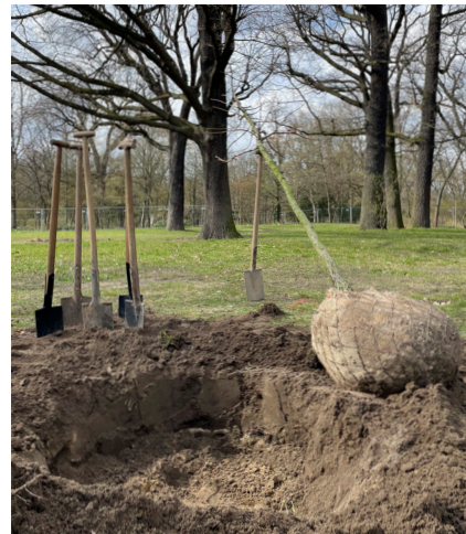
Neupflanzung in der Hasenheide

Ein Highlight ist die klimafreundliche Umgestaltung des Volksparks Hasenheide. Mit hitzeresistenten