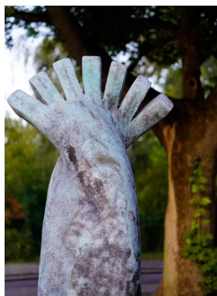
Gedenkstein für Burak Bektaş, der 2012 vermutlich aus rassistischen Motiven in Neukölln ermordet wurde

Trotzdem und gerade deshalb bleibt Neukölln ein Ort des zivilgesellschaftlichen Engagements: Ob Hufeisern gegen Rechts, Rudow empört sich, das Bündnis Neukölln, Omas gegen Rechts oder die Initiative Burak Bektaş – im ganzen Bezirk gibt es Initiativen, die sich gegen Rechtsextremismus und Diskriminierung einsetzen. Auch die AG Antifa des Grünen Kreisverbandes hat über das vergangene Jahr Zulauf erhalten. Lasst uns weiter mit den Betroffenen rechter Gewalt solidarisch sein, lasst uns engagiert bleiben und werden. Für ein offenes, vielfältiges und antifaschistisches Neukölln!