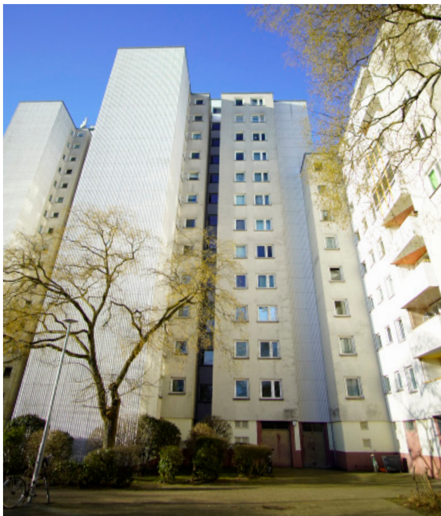
Häuser in der Weißen Siedlung nahe dem S-Bahnhof Kölnischen Heide

Mitglied des Bundestags und Neuköllner Direkt- kandidat für die Bundes- tagswahl 2025