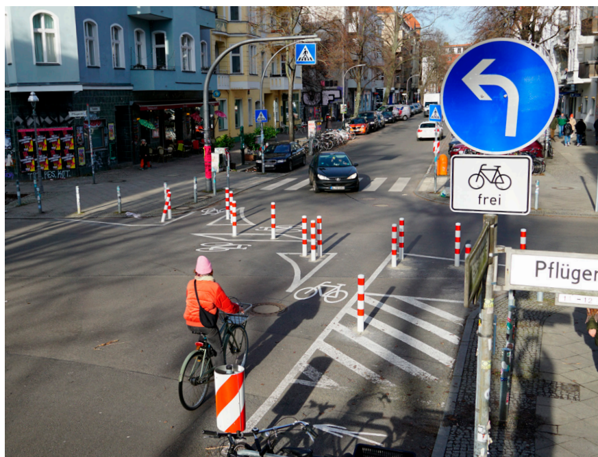
Reuter-Kiezblock: Links abbiegen heißt es für Autos in der Friedel-Ecke Pflügerstraße. Passant*innen und Radfahrende können die Kreuzung weiterhin queren.

Es gibt viel zu tun in unserem Lieblingsbezirk. Mit Initiativen zur Verbesserung der Lebensqualität, konkreten Maßnahmen für mehr Klimaschutz und sozialer Gerechtigkeit sowie dem entschlossenen Einsatz gegen Rechtsextremismus setzen wir auch im kommenden Jahr klare Prioritäten für ein zukunftsfreudiges Neukölln.